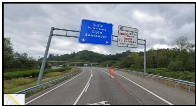
Coger Salida 14 Lieres-Nava-El Entrego.

Si te acercas desde Gijón, Nava o aledaños: