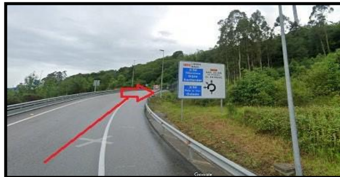
Cogemos Salida El Entrego.