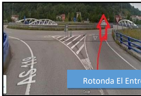
Rotonda El Entrego Dirección Laviana.